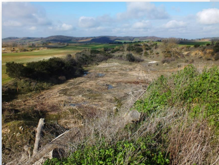
Carrière Nord abritant des espèces protégées

En réponse, le collectif n'exclut pas le fait que recourir à des associations environnementales de plus grande importance et/ou de faire appel une décision de justice afin de faire, enfin, appliquer la loi et les décisions prises par une préfecture semblant très/trop passive à faire appliquer ses propres décisions.