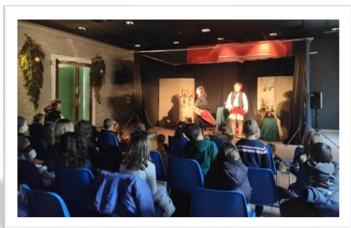
Spectacle La Hotte du Père Noël