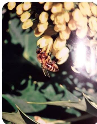
Abeille mellifère sur le mahonia