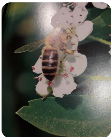
Abeille mellifère sur l'aubépine monogyne