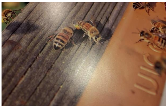
Les premières rentrées de pollen s'observent souvent dès janvier au moment de la floraison du noisetier

Pour la diversité, la composante arborée a été de tout temps un apport décisif pour les abeilles et autres pollinisateurs (papillons, bourdons etc...) : habitat, nutrition, fourniture de pollens diversifiés, apports de nectar, miellats, résines... en dépendent.