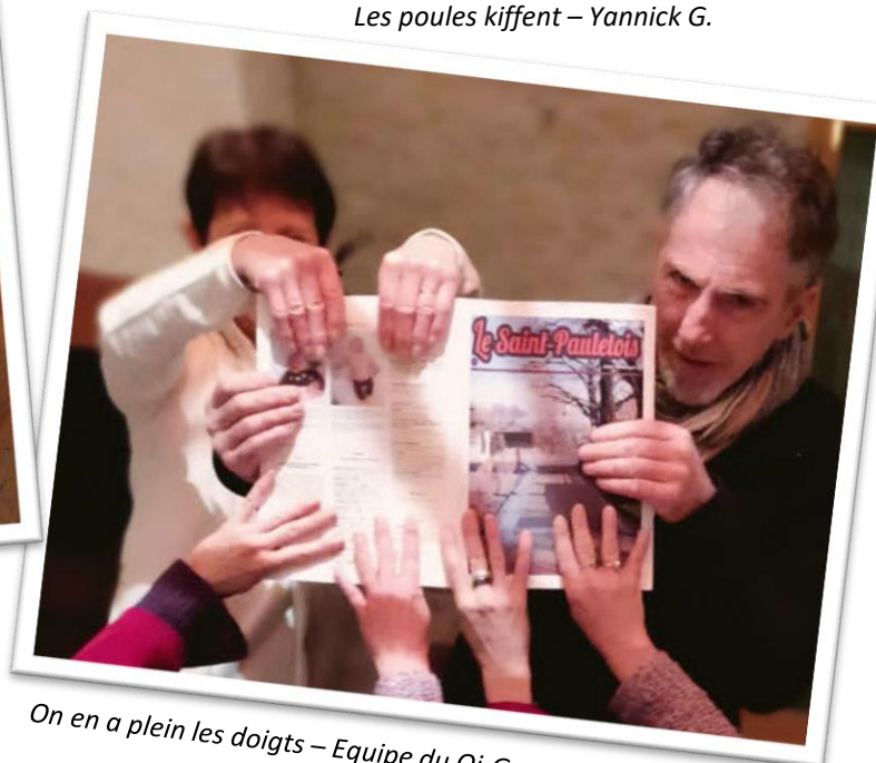
On en a plein les doigts – Equipe du Qi-Gong