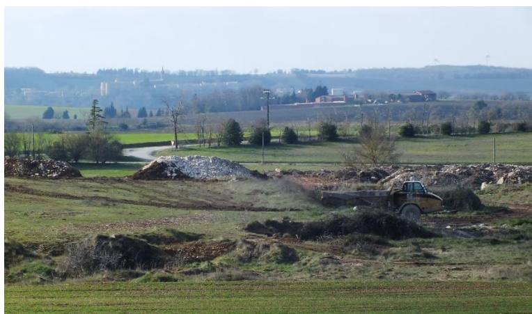
Etat actuel des sites