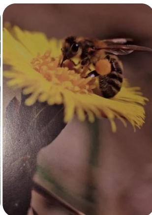
Abeille mellifère sur le tussilage à pas-d'âne