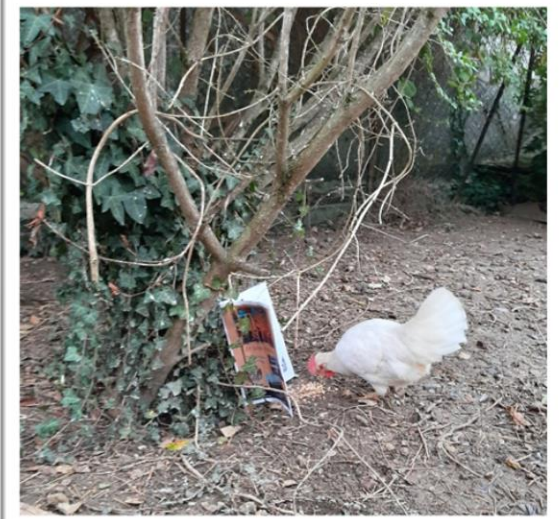
Les poules kiffent – Yannick G.