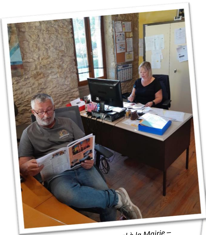
Jour de parution du journal à la Mairie – L'équipe de rédaction du Saint Pauletois