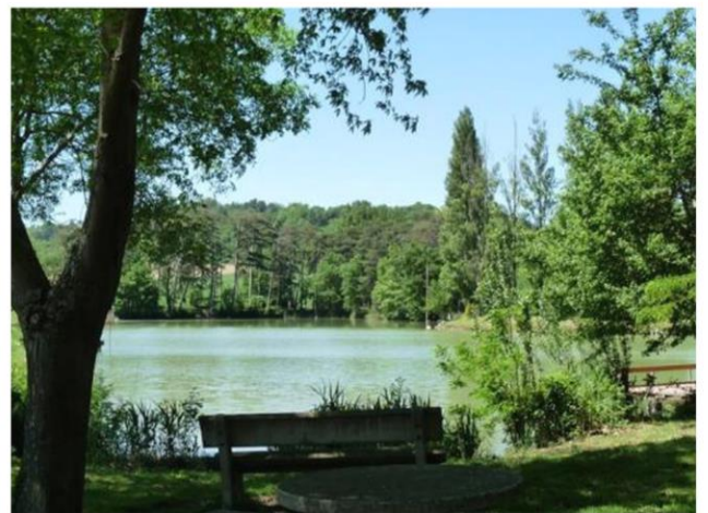
Lac de Lenclas

Nous allons faire du VTT trois fois dans l'année. Quand nous aurons fait deux séances à l'école, nous allons aller faire une balade au lac de Lenclas. J'aime bien faire du VTT parce qu'on peut passer sur des planches.