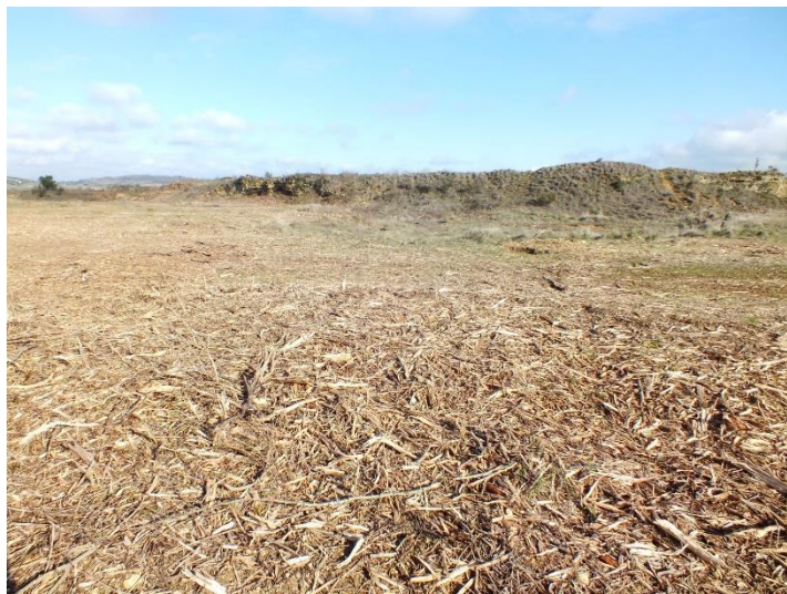
Arbres coupés et broyés sur les 2 sites