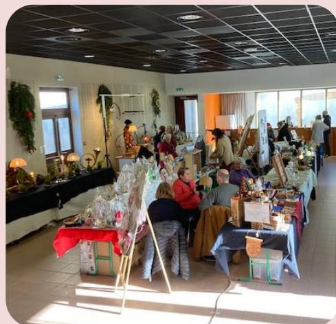
Marché de Noël des créateurs 11 décembre 2022