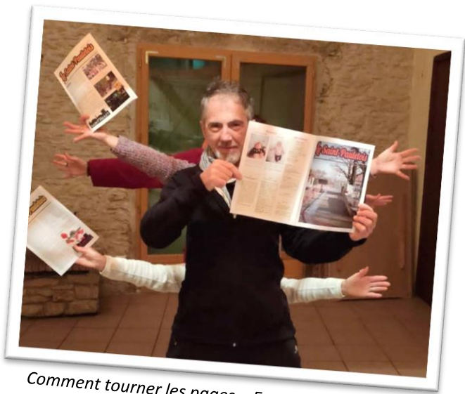
Comment tourner les pages – Equipe du Qi-Gong.